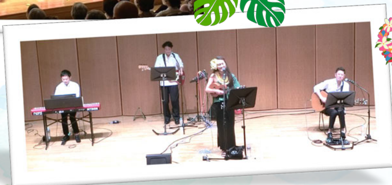
ハワイアンバンド