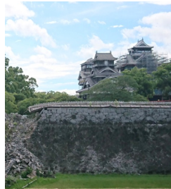
2018年8月/復興途中の熊本城

インタビューで、地元の年配の女性が「熊本城が崩れたのを見て涙が出た。お城は熊本県民の魂だから」と言っており「その方と自分も同じだ!やはり私は熊本県人なんだ」と改めて思いました。