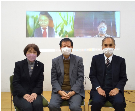
▲ 会場とリモートのハイブリット開催

▲ 広報委員会を中心に、職員の意見を取り入れながら制作しました。(福祉公社の各センター、本部事務所にも設置しています。また、ホームページからもPDFでご覧になれます。)