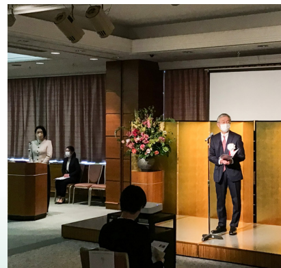
▲ 40周年式典での挨拶

引き続き福祉公社が皆様から信頼され、お役に立てるよう、職員とともにレジリエンスを高める努力を続けてまいります。今年度もどうぞよろしくお願いいたします。